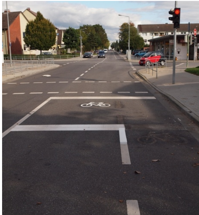
Aufstellbereich vor Ampeln